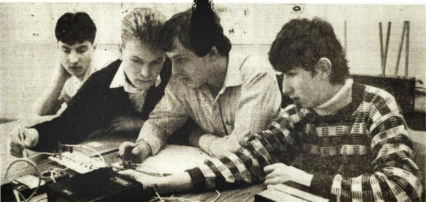
Strední odborné učilište ve Vítkovicích