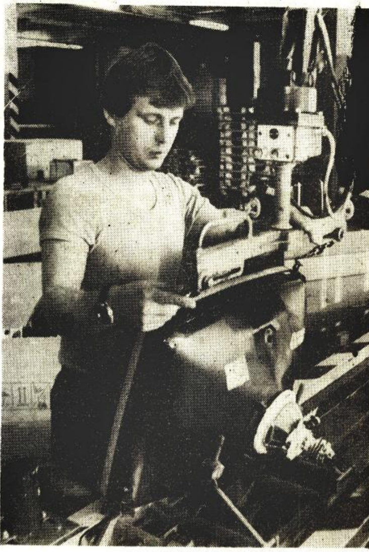
Pracující oboru elektrotechnického průmyslu a elektroniky tvoří zhruba sedminu odborářů našeho svazu.

VZNIKÁ SEKCE ELEKTROTECHNIKY A ELEKTRONIKY