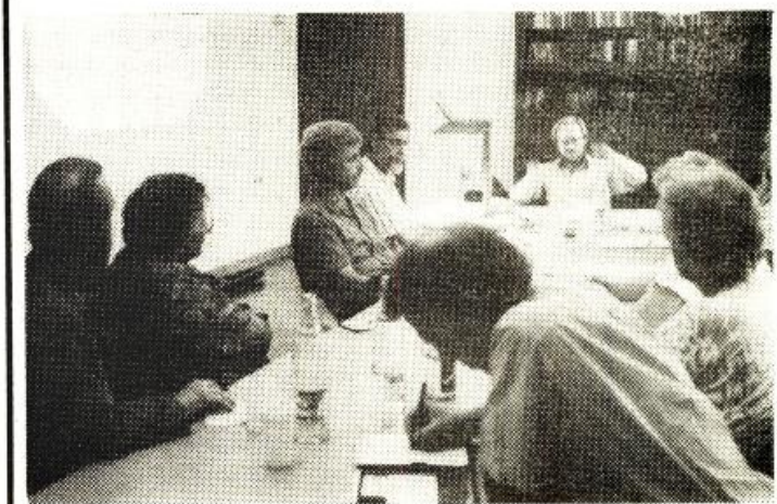
... SOUSEDSKÉ POKLÁBOSENÍ.