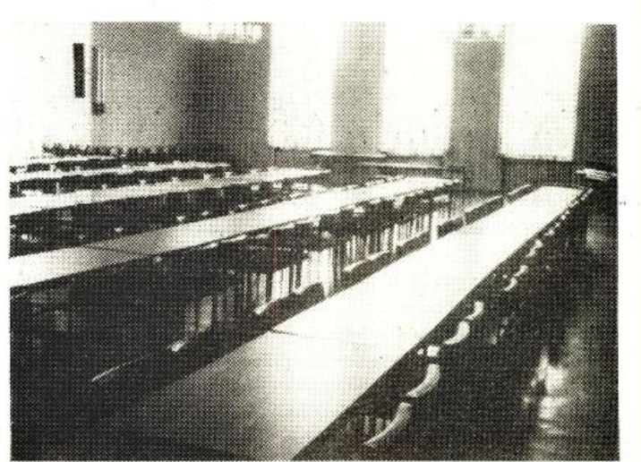
NAMÍSTO MASOVÉHO DISKUSNÍHO FÓRA...

T a situace byla příznačná: Pro všechny společnosti, které prožily více či méně reálnou diktaturu proletariátu a tzv. dělnickou vládu. Příznačná pro postoj „mas“ k odborářině.