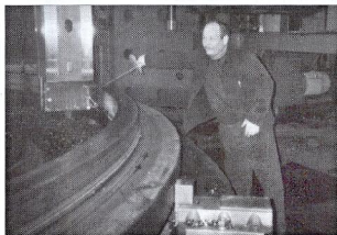
Unex pokračuje ve výrobě ocelových konstrukcí a svařovaných rámu

Když už odborové organizace došla trpělivost nad lečením finanční chudokrevnosti firmy na úkor zaměstnanců, obrátila se koncem letošního