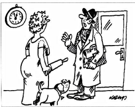
Opravdu se pracím ze školení. Ale pro vyzrůvnutí mé lektor nechaj po škole...

S 7 Pracovní právo - vybrané kapitoly: 7. 4. - 8. 4. 2004, Na Květnici, Praha 4 (35)