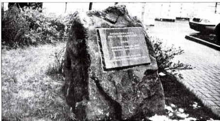
Základní kámen továrny CONTA byl v Podbořanech položen 7. listopadu 2000