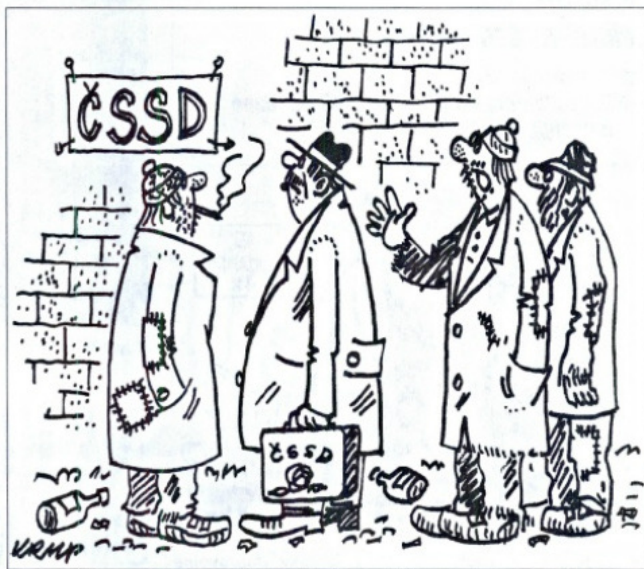
Pro vás je to možná název vládní strany, ale my to čteme "čekaňte snížení sociálních dávek"...